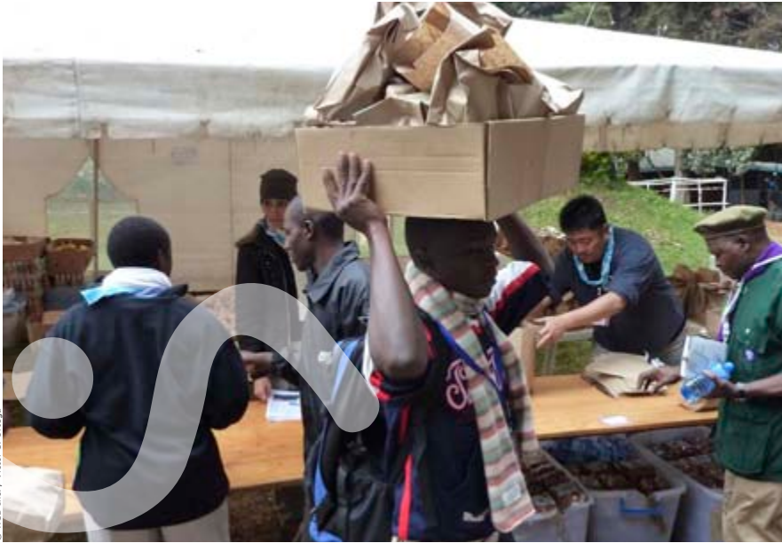
© WSB Inc. / Victor C. Ortega