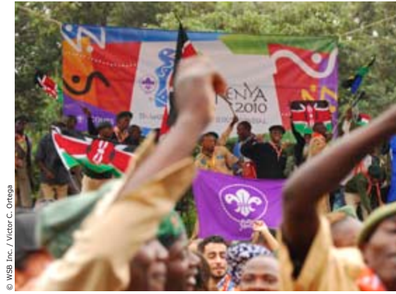
© WSB Inc. / Victor C. Ortega