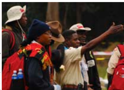
© WSB Inc. / Victor Onegpa

Né le ou avant le 26 Juillet 1984. Le nombre maximal admissible de personnel de contingent variait sur la base du nombre total de participants au sein du contingent comme détaillé ci-dessous :