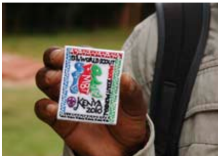
© WSB Inc. / Victor Ortega