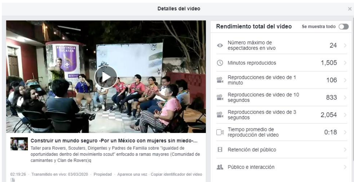
Anexo 3. Estadísticas de vistas de Transmisión en vivo de segunda Charla de café