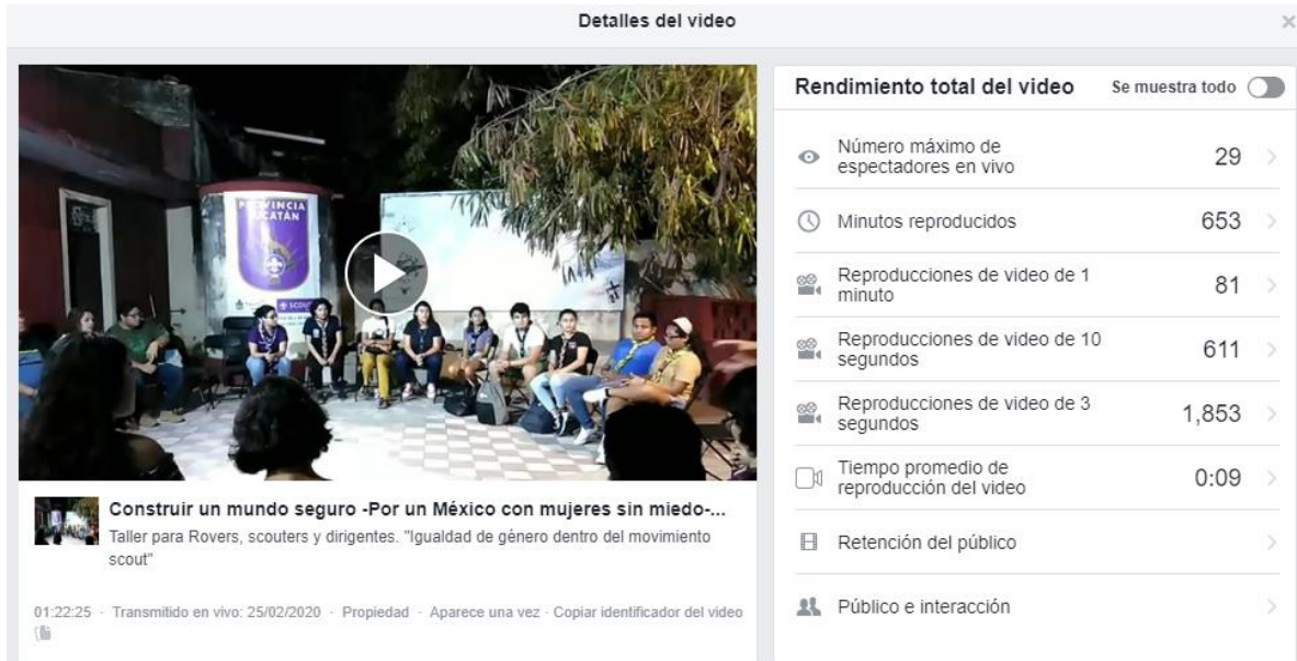
Anexo 2. Estadísticas de vistas de Transmisión en vivo de primera Charla de café